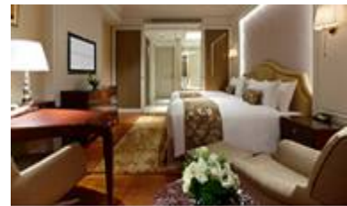
台北大倉久和大飯店圖片